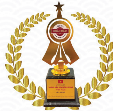
CÔNG BỐ GIẢI THƯỞNG: THƯƠNG HIỆU – SẢN PHẨM – DỊCH VỤ VIỆT NAM LẦN THỨ 10 – NĂM 2023

Ngày 25/11/2023, Nhà Hàng Biển Dương đã vinh dự nhận giải thưởng vàng “ Dịch vụ Hoàn Hảo ” trong Chương trình “Lễ công bố Thương Hiệu - Sản Phẩm - Dịch vụ Việt Nam lần thứ 10 - năm 2023”. Giải thưởng đã tôn vinh những đóng góp tích cực của các thương hiệu trong việc phát triển bền vững cho kinh tế - xã hội Việt Nam.