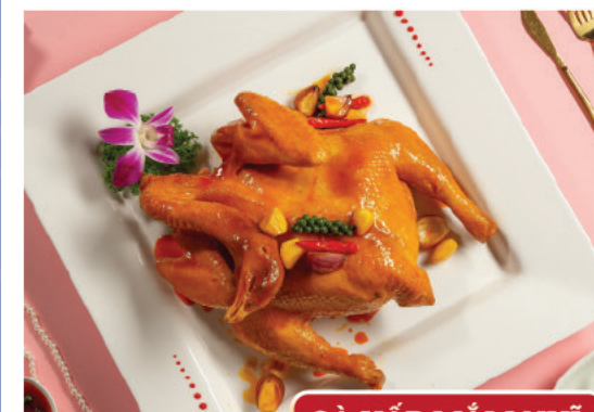
GÀ HẤP MẮM NHĨ