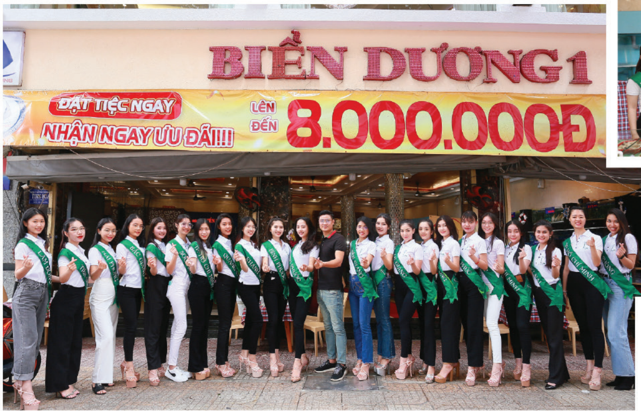
BIỂN DƯƠNG ĐỒNG HÀNH CÙNG HOA HẬU TOÀN CẦU 2023