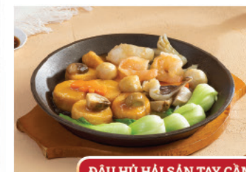
ĐẬU HỮ HẢI SẢN TAY CẦM

Hương vị món Hoa của chúng tôi thường được khách hàng đánh giá là đậm đà, phong phú và tinh tế. Mỗi món ăn không chỉ là một sự kết hợp của các nguyên liệu đặc trưng, mà còn là một chuyến phiêu lưu trên con đường khám phá văn hóa ẩm thực Trung Hoa.