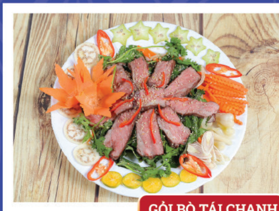
GỎI BÒ TÁI CHANH