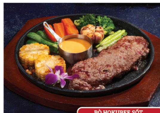
BÒ HOKUBEE SỐT PHÔ MAI TRỨNG MUỐI

Với menu đa dạng và phong phú, chúng tôi cam kết đáp ứng mọi nhu cầu ẩm thực của bạn, từ những bữa trưa đơn giản đến những bữa tiệc sang trọng. Nhà hàng Biển Dương, nơi thỏa mãn mọi ước mong về ẩm thực Việt.