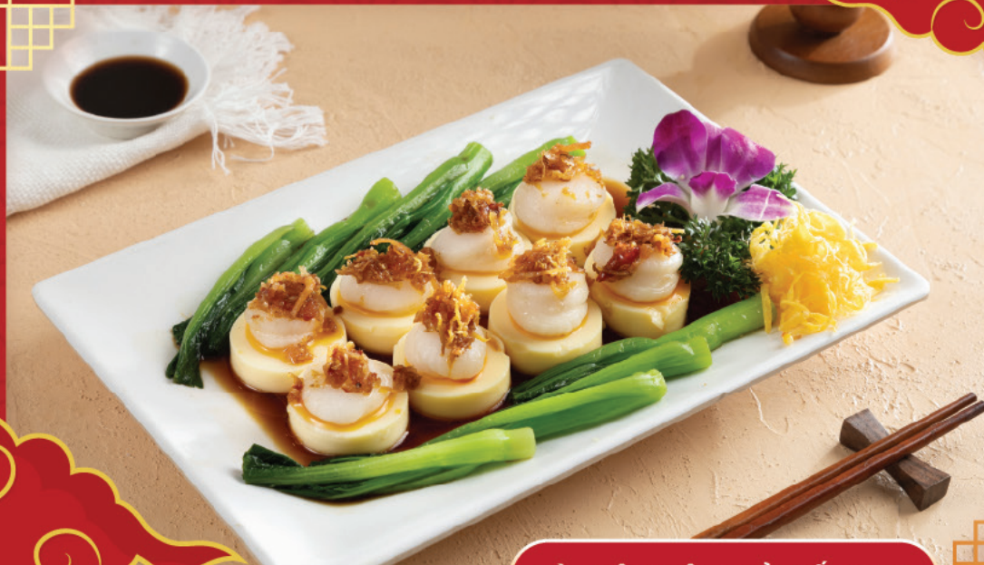
SÒ ĐIỆP ĐẬU HỮ HẤP X.O

Tại Nhà hàng Biển Dương, khách hàng sẽ được thưởng thức không chỉ hương vị truyền thống của ẩm thực Việt mà còn phải kể đến những món ăn đặc trưng của ẩm thực Trung Hoa. Với sự đam mê và kinh nghiệm lâu năm, mỗi món ăn chúng tôi đều kể lên một câu chuyện về văn hóa và truyền thống ẩm thực từ vùng đất Trung Hoa.