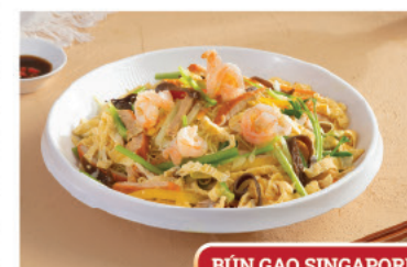
BÚN GẠO SINGAPORE