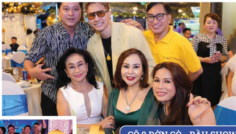
CÔ 9 ĐỜN CỜ - BẦU SHOW