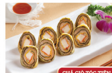
CHẢ GIÒ TÓC TIỀN