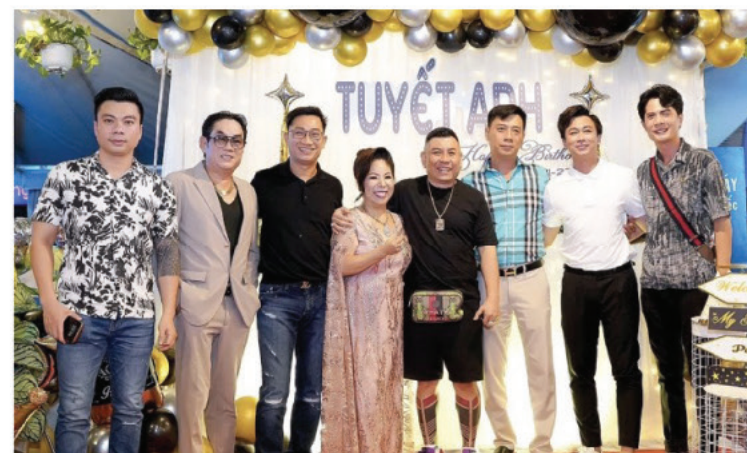
SỰ GÓP MẶT CA SĨ ĐÀM VĨNH HƯNG