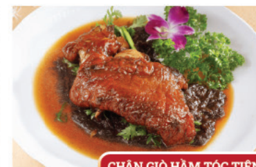
CHÂN GIÒ HẪM TÓC TIỀN