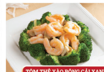
TÔM THẺ XÀO BÔNG CÁI XANH