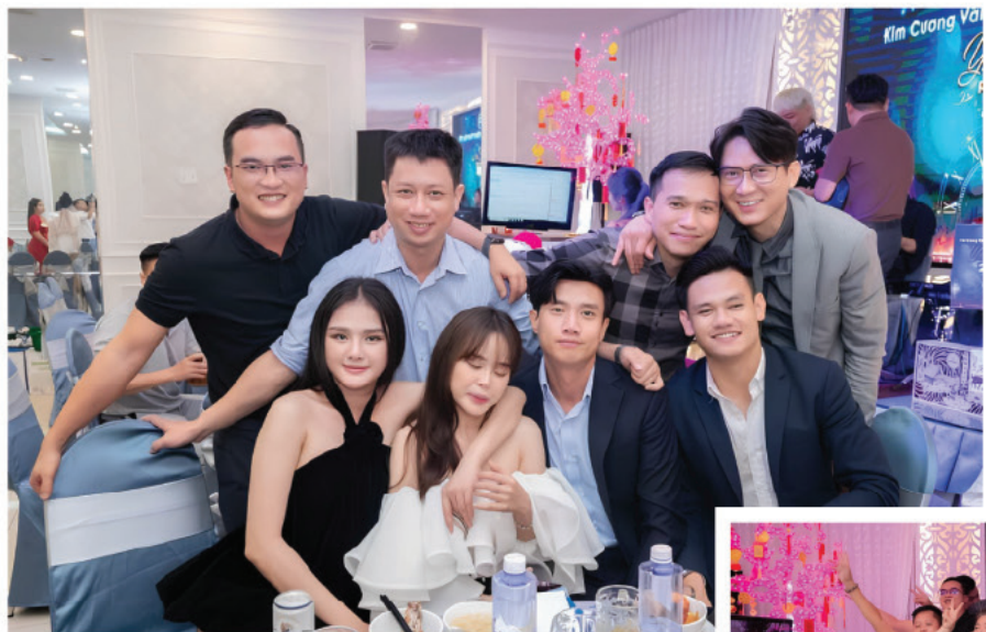
TẤT NIÊN CÔNG TY KIM CƯƠNG VÀNG

Nhà hàng của chúng tôi tự hào đồng hành cùng nhiều nghệ sĩ nổi tiếng, mang đến trải nghiệm ẩm thực độc đáo và phóng khoáng. Hãy đến và thưởng thức không gian sang trọng và đẳng cấp cùng với những tác phẩm nghệ thuật ẩm thực tuyệt vời.