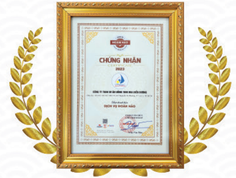
CHỨNG NHẬN DỊCH VỤ HOÀN HẢO

Nhà Hàng Biển Dương được công nhận với phương châm “Luôn lắng nghe khách hàng và nắm bắt xu hướng ẩm thực của thực khách”. Đây là kết quả của sự nỗ lực phát triển sản phẩm Hải sản tươi sống và đa dạng hóa Thực đơn với nhiều loại hải sản trong và ngoài nước cùng nhiều phương thức chế biến mang đậm phong vị ẩm thực Hoa – Việt.