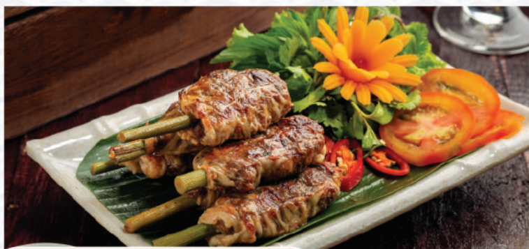
BÒ ÚC LỤI XẢ NƯỚNG

Nhà hàng Biển Dương là nơi gìn giữ và phát triển hương vị truyền thống của ẩm thực Việt. Với đội ngũ đầu bếp giàu kinh nghiệm, có hơn 20 năm chinh phục những khẩu vị khó tính nhất, chúng tôi tự tin mang đến cho bạn những món ăn ngon, hấp dẫn và đậm chất đất nước.