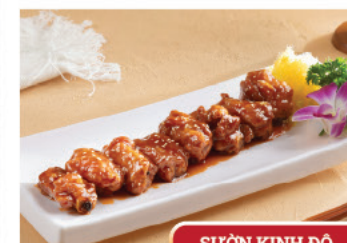
SƯỜN KINH ĐỎ