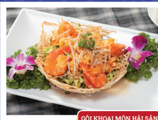
GỎI KHOAI MÔN HẢI SẢN