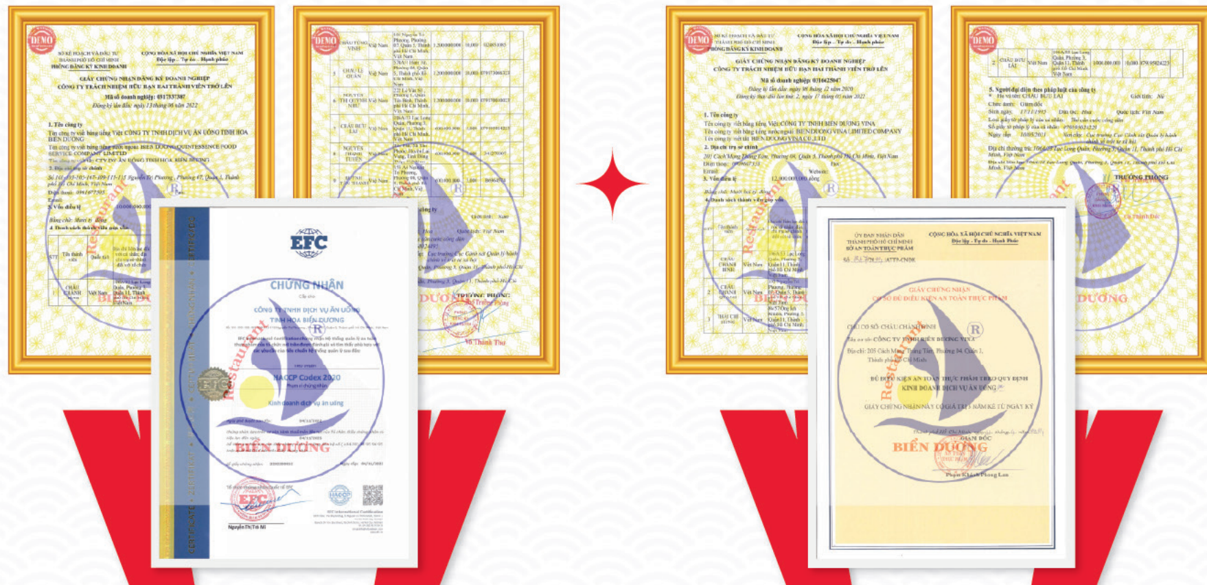
GIẤY PHÉP KINH DOANH VÀ CHỨNG NHẬN AN TOÀN THỰC PHẨM BIỂN DƯƠNG 1